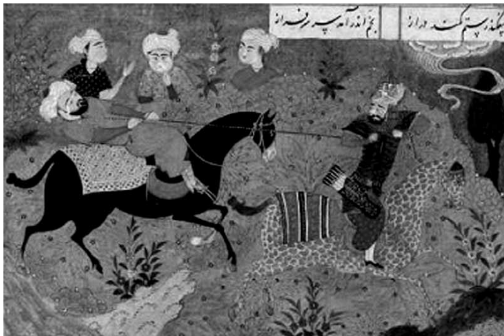
Рустам арканит Аулада, иллюстрированный манускрипт эпохи Тимуридов, 1486 г. Британская Библиотека, Лондон