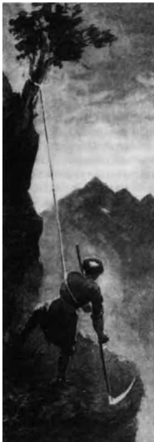
Осетинский косарь в горах. Худ. В. Лермонтов