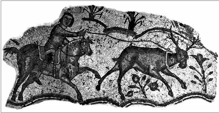
Вандало-аланский всадник с арканом. Мозаичный пол из виллы на холме Бордх-Джедид, Тунис (конец V – начало VI вв. н.э.). Хранится в Британском Музее, Лондон (инв. № 1967,0405.16)

Интересно обратить внимание и на то, что мотив охоты всадника на оленя является одним из наиболее популярных у древних кочевников, его мы часто находим на скифских, сакских и сарматских изображениях, его же видим в мифах о причинах появления гуннов и венгров в Европе. Более того, он является одним из любимых мотивов нартовского эпоса осетин, где рогатый олень — это любимая и наиболее желанная добыча для охотника. По справедливой характеристике В.И. Абаева, олень — это «излюбленное животное осетинского фольклора. Охота на оленя — это охота par excellence , а оленьё мясо — обязательное угощение всякого нартовского пиришества» [АБАЕВ 1949: 49]. Известен в фольклоре осетин и мотив поимки оленя с помощью аркана 18 . Так, к примеру, в позднесредневековой песне о Красавице-Азаухан, героиня обещает выйти замуж за того, «Кто из оленьего стада, что на Кумской равнине, | Отделит старого оленя ( sædsigon sag ), | Прогонит мимо башни Дзулат, | И, заарканув его, ( Arqan ibæl ragældzgæj ) | Привяжет к коновязи под башней Дзулат» [ПНТО 1992: 111–112] 19 .