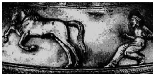
Образы скифских коневодов, арканивших лошадей. Серебряная амфора из кургана Чертомлык (IV в. до н. э.)