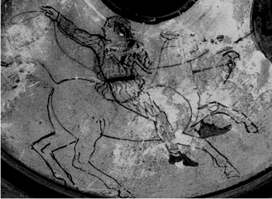
Изображение сарматской амазонки, вооруженной топориком-сагарисом, скачущей от врага и набрасывающей на него аркан. Аттический сосуд

Приднепровье, и идентичный персонаж на аналогичном предмете из Сенгилеевского кургана, недавно обнаруженном на Ставрополье. На обоих изображениях видим однотипного персонажа, чье туловище с правого плеча под левую подмышку обернуто многовитковыми петлями, напоминающими веревку или аркан 2 .