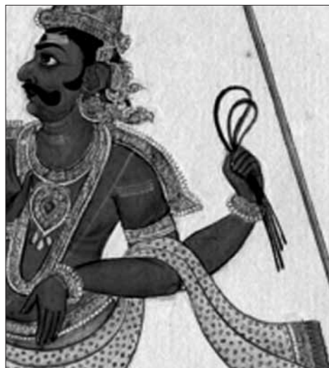
Слева индо-сакский царь Азес верхом на коне с арканом или петлей в руке. Справа образ бога Ямы с арканом в руке