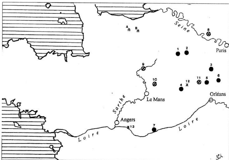
Le territoire du royaume Alain en Gaule du nord-ouest (Ca. 442-452).

1 à 7: Toponymes pouvant provenir du nom ethnique «Alain»: 1 – Alaincourt; 2 – Allainville-en-Drouais; 3 – Allainville-aux-Bois; 4 – Courtalain; 5 – Allaines-Mervilliers; 6 – Allainville-en-Beauce; 7 – Langeais ( Alagaviense au VI e s.).